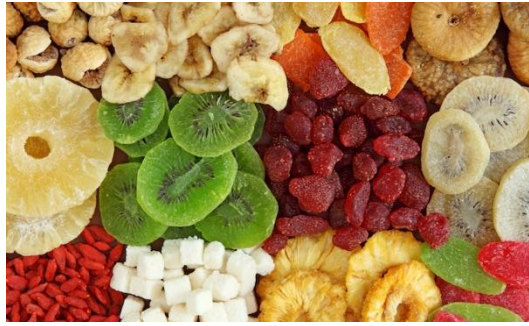
ក្រោមគំរោងឧបត្ថម្ភដោយ